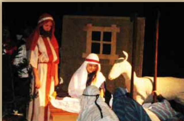
Joulukuvaelma kirkonkylän ala-asteen joulujuhlissa 2006.