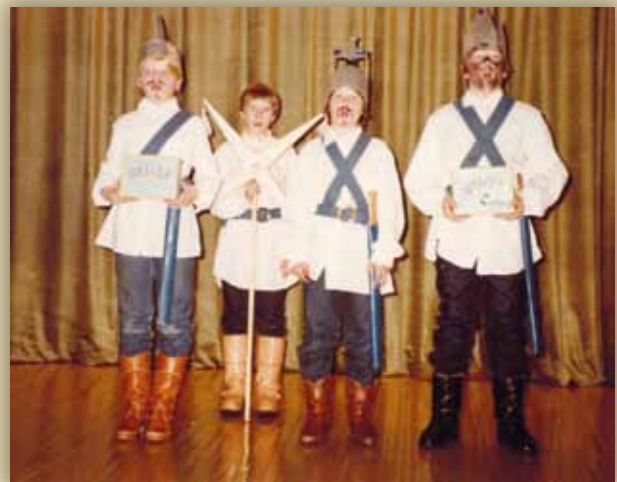
Susimäen koulun Tiernapojat lauloivat rahaa Unicefille. Nykyään murjaanien kuninkaan naaman mustaamista pidetään rasistisena.

Kyläkoulujen kadottua myös perinteiset kuusijuhlat ovat jääneet historiaan tai ainakin tulleet harvinaisemmiksi. Yhteiskunnan muuttuessa koulun juhlien luonne on muuttunut; tunnustuksellisia juhlaohjelmia joulu- tai suvivirsineen kuullaan yhä harvemmin. Monikulttuurisuus ja suvaitsevaisuus, ehkäpä yleinen kulttuurinen muutos ”maallistuneempaan” suuntaan hävittää tai ainakin vahvasti muokkaa tätäkin perinnettä.