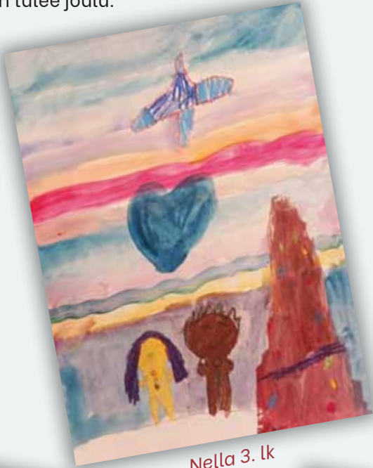
Nella 3. lk

Aada, 3.lk: Joulu on aikaa, jolloin saa olla per-heen kanssa ja syödä hyvää ruokaa ja herkkuja. Silloin saa myös olla rauhassa ja koristella jou-lukuusta.