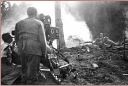
Ruotsissa kuvattua hyökkäystä vihollisen aseisiin.

Tukholman lähellä sijaitsevan hoitopaikan ylläpitäjänä toimi Ruotsin Punainen Risti. Hoito kesti neljä kuukautta. Hoidon loppuaikoina suomalaiset sotilaat järjestivät taistelunäytöksen elokuvan tekijöiden pyynnöstä. Kasapanoksia räjäyteltiin hiekkaisessa maastossa, ja sotilaat tekivät rynnäkön vihollisen aseisiin. Lyhytfilmiä näytettiin Ruotsissa elokuvien alussa.