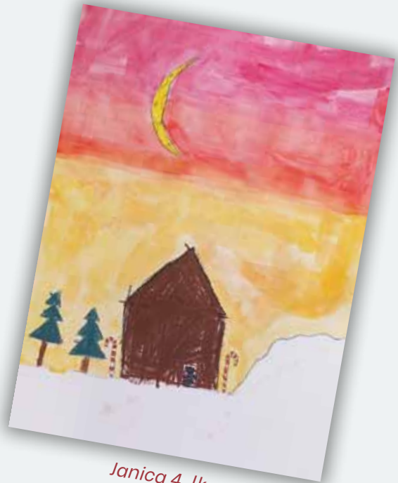
Janica 4. lk