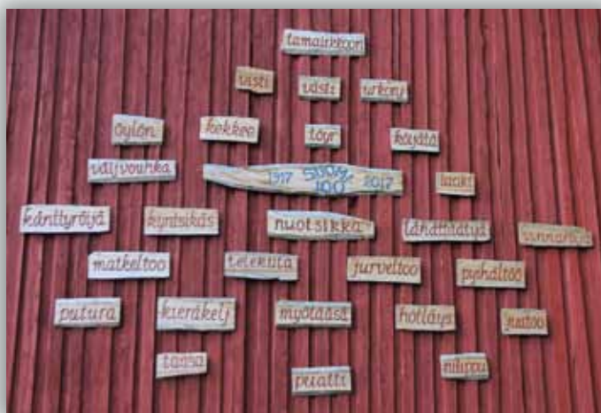
Museon itäpäädyn sanaseinä.

tehtävä liittyy toisaalta menneisyyteen, toisaalta nykyyhetkeen ja myös tulevaisuuteen. Toiminnassaan yhdistys pyrkii kotiseudun asioiden kehittämiseen yhteistyössä ja sopuisassa hengessä muiden tuusniemeläisten järjestöjen kanssa. Yhteistyökumppaneitamme ovat vuosikymmenten saatossa olleet mm. Tuusniemen kunta, Tuusniemen seurakunta/Järvi-Kuopion seurakun-