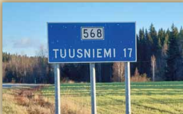
Lapinjärven sijainti.