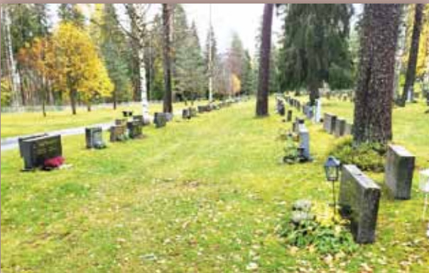
Ei reunakiviä ei hautakumpuja

Hautausmaan edustavimmaksi osaksi muodostuneen kirkon itäpuolella oleva osa. Hautausmaan pinta ja hautakivien väliset käytävät tulevat yhtenäisen nurmen peittämiksi ja hautarivit erotetaan toisistaan leikkaamalla kasvatettavilla pensasaidoilla. Ne kaunistavat hautausmaata ja antavat haudankaivajalle selvän suunnan hautapaikan