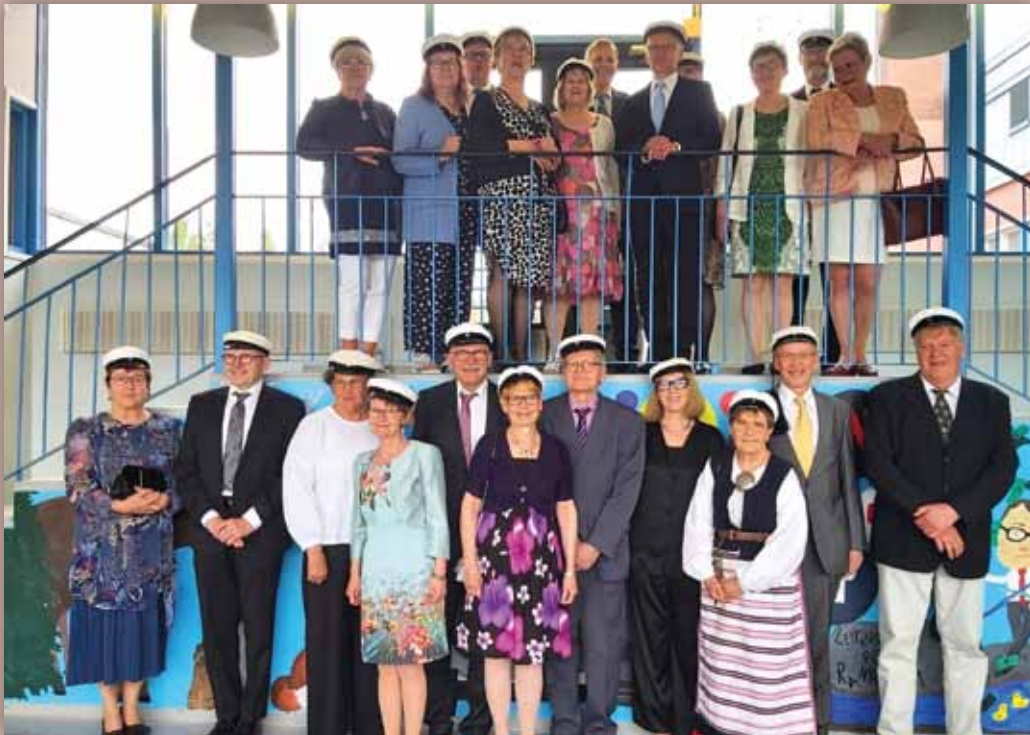
Tuusniemen lukion riemuylioppilaat 4.6.2023 (kevällä 1973 Tuusniemen lukiosta lakitetut).