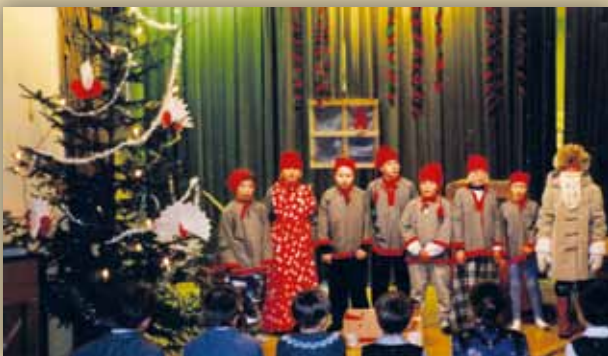
Susimäen koulun joulujuhla v. 1983, Korvatunturin väki näytelmän loppunäytöksissä ja -kumarruksissa.

Silloin lapsijoukko hiljeni odottamaan, mitä asiaa – ja ennen kaikkea, mitä tuliaisia – pukilla olisi. Ja olihan niitä. Kun pukki oli ohjattu istumaan, muutamia isoimpia oppilaita värvättiin pukin apulaisiksi, ja heidän tehtävänsä oli jakaa kaikille lapsille joulupussit, joiden sisältä löytyi pulla tai piparkakku, jouluomena, karkki, ehkäpä jokunen kiiltokuvaakin. Joulupukin kontista jaettiin myös pieniä joulukortteja, joita oppilaat olivat toisilleen kirjoittaneet ja ”lähettäneet Korvatunturin kautta”. Oppilaiden kortit olivat tavallista pienikokoisempia, ja niihin oli kirjoitettu saajan nimen lisäksi osoitteen tilalle ”Joulujuhlissa”, ”Kuusijuhlissa” tai ”Kuusella”.