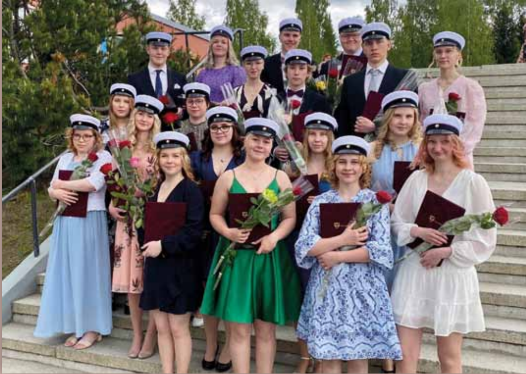
Tuusniemen lukion ylioppilaat 4.6.2023.