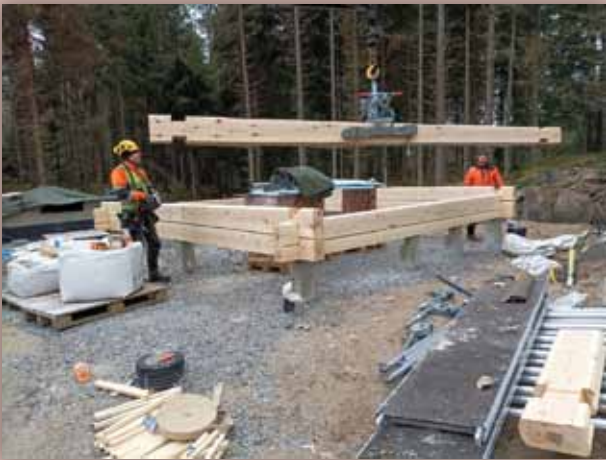
Hirsikehikon pystytykseen päästiin lokakuun lopulla, Kuvassa olevat miehet ovat Perinnerakenne Oy:n työntekijöitä.

Viime vuoden marraskuussa tuhopolletun savusaunan tarina saa jatkoa uuden saunan myötä Koillis-Tuusniemen kyläyhdistyksen tukikohdassa Kaavinkoskella. Kyläyhdistyksen väki päätti yksimielisesti jatkaa hyvin toiminutta yhteisöllistä palvelua.