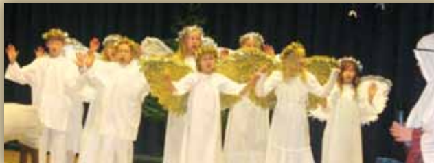
Enkelikuoro kirkonkylän ala-asteen joulujuhlasta 2006.

Perinteisiin kuusijuhliin kuului myös Joulupukin vierailu. Kun juhla alkoi olla loppuillaan, väki lauloi: "Joulupukki, Joulupukki, valkoparta, vanha ukki..." – ja eipä aikaakaan, kun eteisestä alkoi kuulua ko-