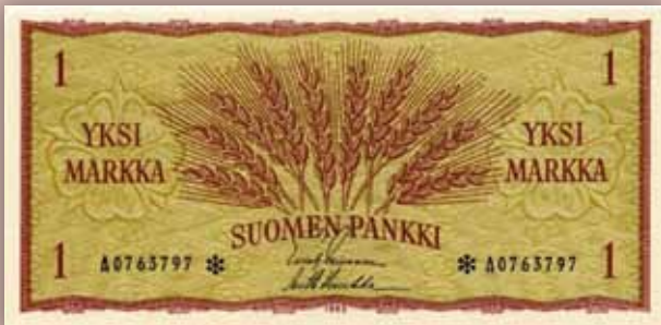
Uudistettu Suomen markka. Arkistokuva.