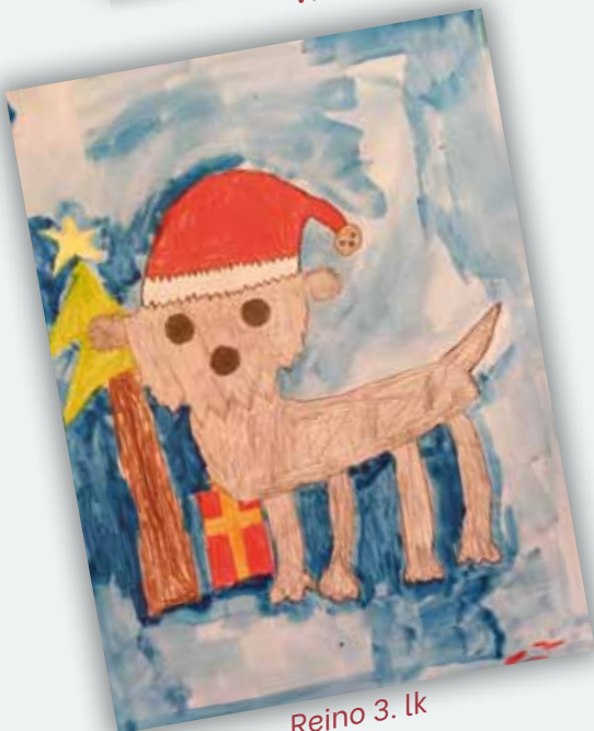
Reino 3. lk