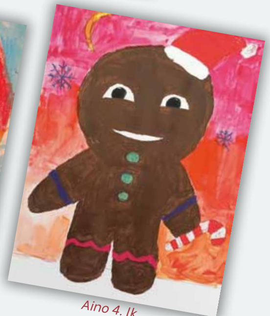
Aino 4. lk