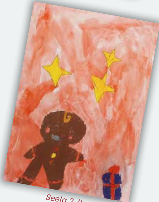
Seela 3. lk