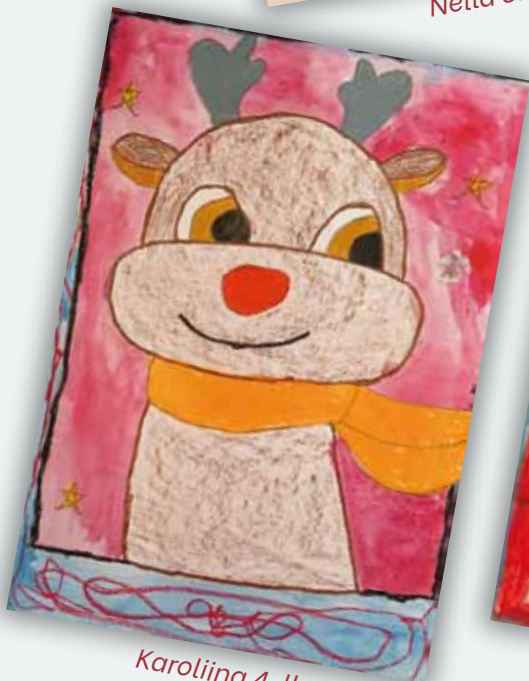
Karoliina 4. lk