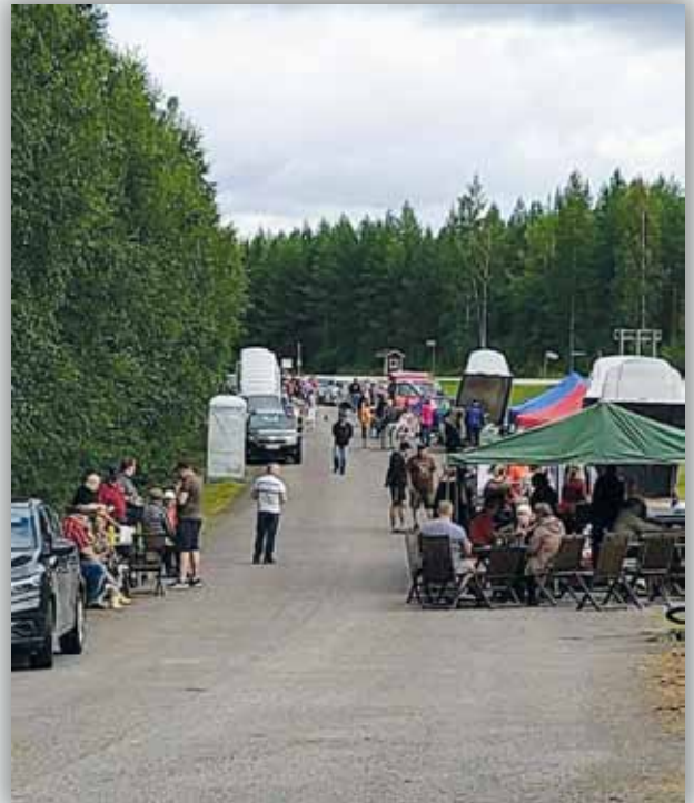
Rompepäivä 2023 Ohtaansalmen sillankuppeessa.

Konepajalla saatiin kokemus toinen, tekniikan ja koneiden määrä siellä aikamoinen. Kuljettiin kyliämme ristiin ja rastiin. Paljon oli näytettävää, ihan oppailla hiki tuli naattiin. Todettiin, että kylä hyvä on meillä!