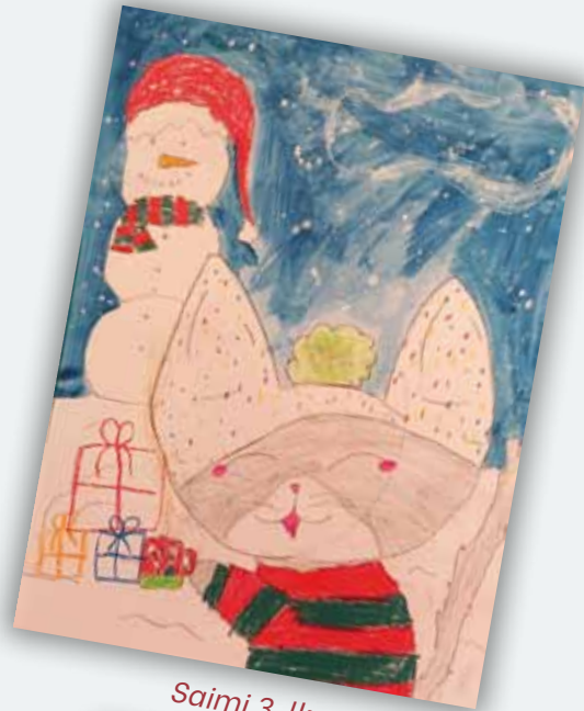
Saimi 3. lk