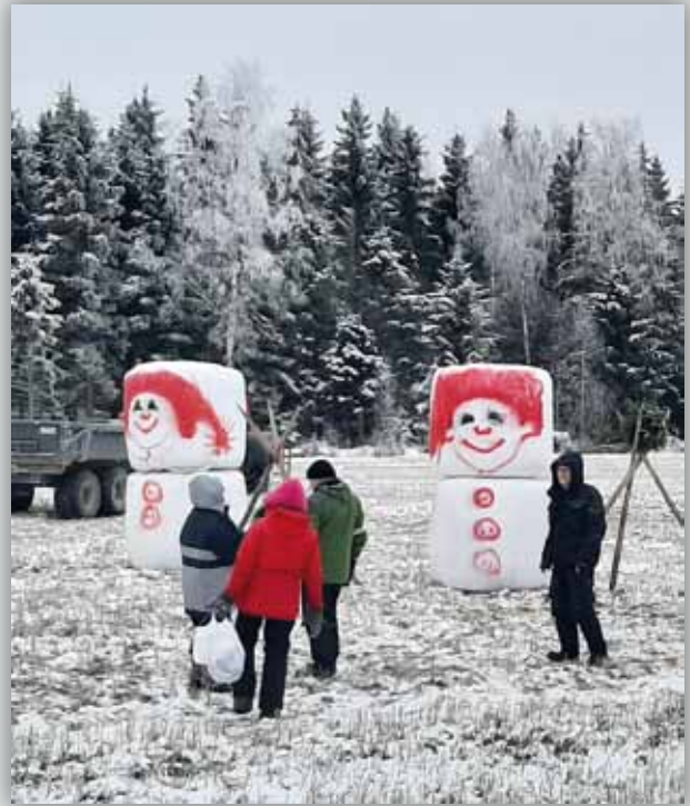
Paalitontut toivottavat hyvää joulua Ysitien kulkijoille Paackilassa.

Alku syksystä lehmän lypsystä Aarokin rientää: se kokousta tietää. Arjalla herkut ja synttärarit, asioita monia, yhteenvetoa, naurua ja onnittelulaulua. Hyvin voi yhdistys tämä, porukkakin kuin ryhmä rämä. Hetki lepoa, sitten taas jaksaa, Myrsky teki kyllä uimarannalle laituriraksaa.