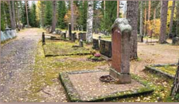
Hautausmaalla liikkuva voi omin silmin nähdä missä määrin suunnitelmat ovat toteutuneet.

Hautausmaan edustavimmaksi osaksi muodostuneen kirkon itäpuolella oleva osa. Hautausmaan pinta ja hautakivien väliset käytävät tulevat yhtenäisen nurmen peittämiksi ja hautarivit erotetaan toisistaan leikkaamalla kasvatettavilla pensasaidoilla. Ne kaunistavat hautausmaata ja antavat haudankaivajalle selvän suunnan hautapaikan